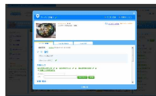
マーカー詳細ページ